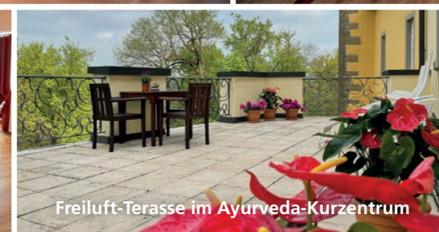
Freiluft-Terrasse im Ayurveda-Kurzentrum