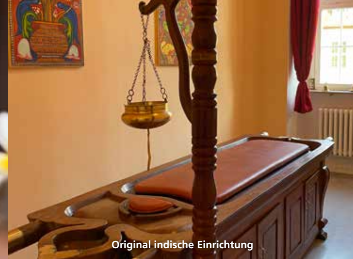
Original indische Einrichtung